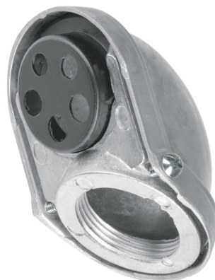
Entrada 1 1/4" (32 mm)