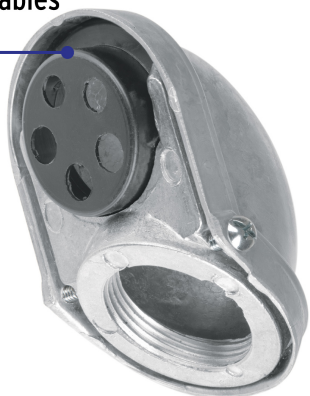
Cuerpo de aluminio