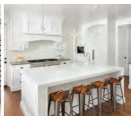
Cocinas o áreas de preparación de alimentos