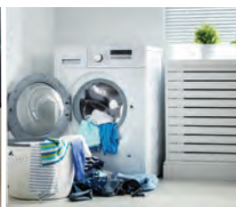
Áreas de lavado, lavanderías y patio de servicio