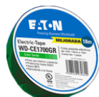
WD-CE1700GR Color: Verde