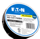
WD-CE1700BK Color: Negro

Cinta eléctrica de PVC para aislamiento hasta 600 V 18m x 19mm