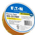
WD-CE1700Y Color: Amarillo