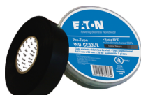
WD-CE33UL Cinta eléctrica de PVC para aislamiento hasta 600 V Máximo de Temp. 105°C (1 hr max.) 18m x 20mm Auto extingüible Disponible en color: Negro