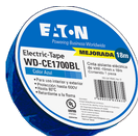
WD-CE1700BL Color: Azul