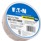
WD-CE1700W Color: Blanco