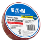
WD-CE1700RD Color: Rojo