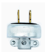
WD0551 Blindada entrada recta 15A 127V~